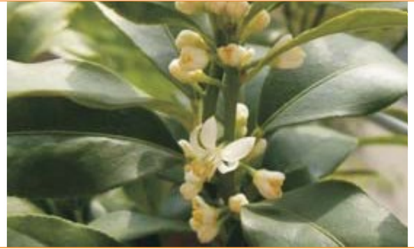
Imagen 10: unos días después, en septiembre de 2011 Aquí el “mar de flores” es más visible

Imagen 9: Julio de 2009 Aquí los brotes están empezando a abrirse