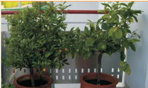
Imagen 5: Julio de 2009 Crecimiento en todas direcciones, con frutos

“Es realmente asombroso los cam- bios y desarrollos que son posibles a través del uso de QUANTEC® .”