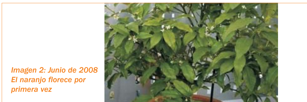
Imagen 2: Junio de 2008 El naranjo florece por primera vez