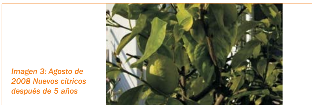
Imagen 3: Agosto de 2008 Nuevos cítricos después de 5 años