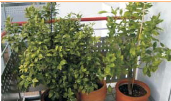
Imagen 8: Septiembre de 2011 También este año, el naranja vuelve a florecer, definitivamente más de 500 flores, los frutos se- guirán. El pequeño cítrico tiene flores y frutos. Am- bas plantas ahora tienen alrededor de 120 cm de altura.