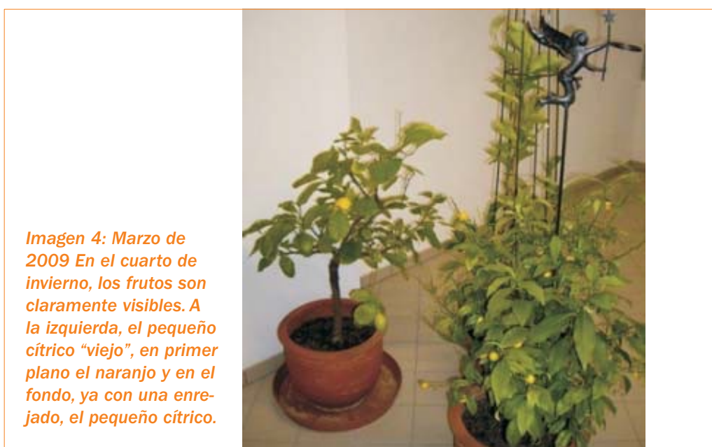
Imagen 4: Marzo de 2009 En el cuarto de invierno, los frutos son claramente visibles. A la izquierda, el pequeño cítrico "viejo", en primer plano el naranjo y en el fondo, ya con una enrejado, el pequeño cítrico.