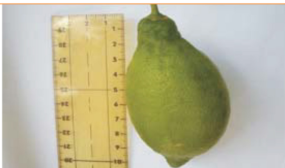
Imagen 7: Septiembre de 2011 Esto es un tamaño notable (viejo cítrico). Este año, nuevamente alrede- dor de 10 frutos.