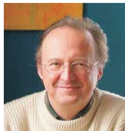
Barão Rudolph von Schröder

Entretanto, para mim está claro que QUANTEC® fez a diferença e que este ano aumentarei as superfícies tratadas exclusivamente com QUANTEC®.