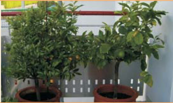
Immagine 5: Luglio 2009 Crescita in tutte le direzioni - con frutti