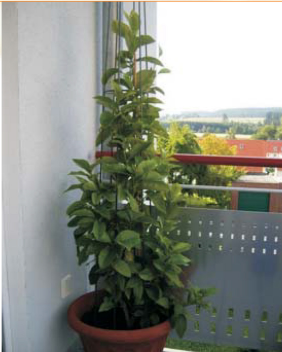
Immagine 6: Luglio 2009 Questo era una volta un piccolo albero di limoni